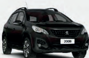
PRETO PERLA NERA